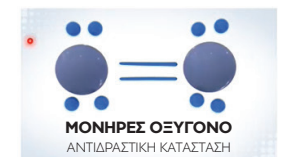
και έτσι μετατρέπουν το μόριο του οξυγόνου από τη φυσική του κατάσταση σε ένα μόριο αντιδραστικό που ονομάζεται μονήρες οξυγόνο