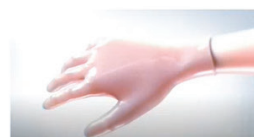
η επιστροφή στο γάντι απορροφά την ενέργεια του φωτός