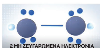
προκαλώντας τα μη ζευγαρωμένα ηλεκτρόνια