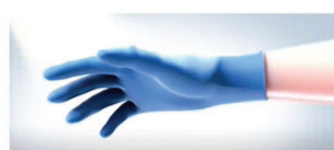
Με την παρουσία φωτός