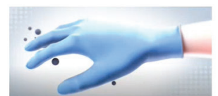
και μεταφέρει την ενέργεια στα μόρια του οξυγόνου που βρίσκονται στον αέρα